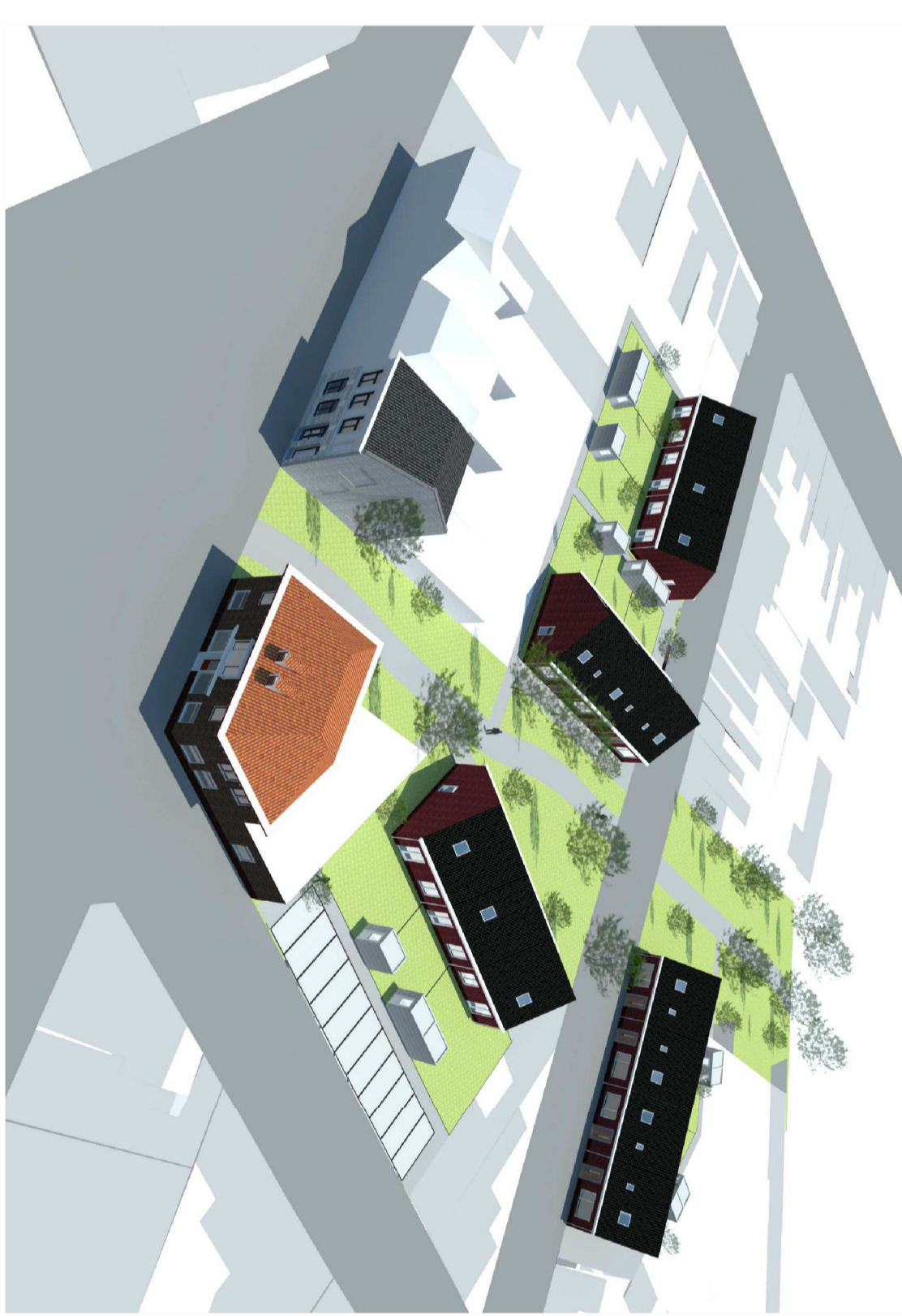
plangebied C & D = locatie Lidl