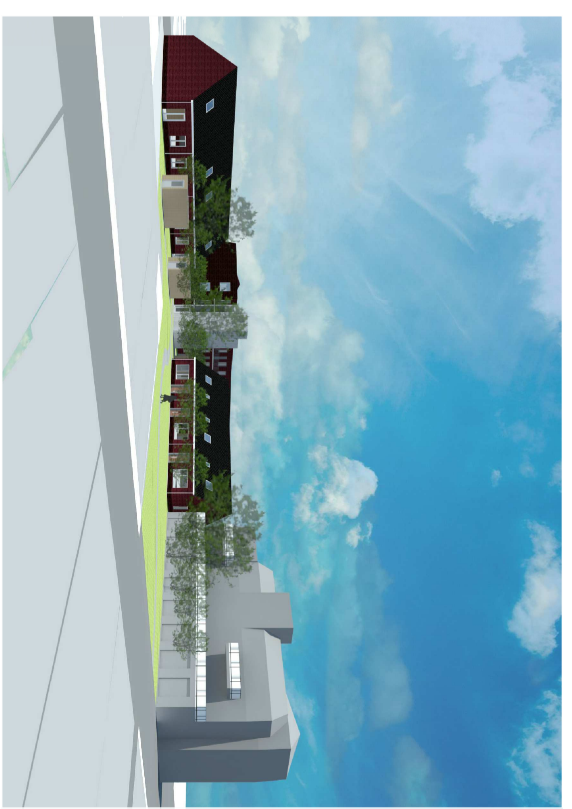
plangebied B locatie Albert Heijn