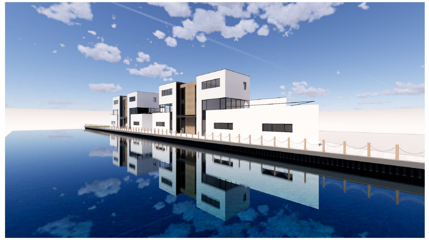
Aan deze impressie kunnen geen rechten worden ontleend.

d 12-08-2019: gewijzigd 10-05-2019: datum